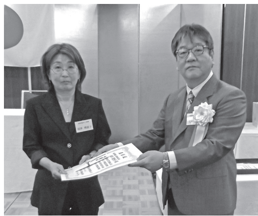
浦津電気工事(株) 優良組合員表彰