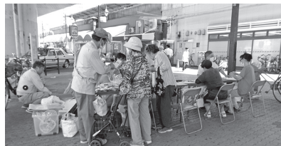
昨年の様子(西淀川地区)